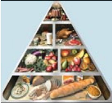
الهرم الغذائي... تبسيط ما نأكل