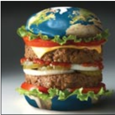
العولمة والنقلة التغذوية