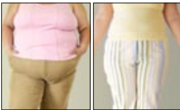
العالم يعاني البدانة